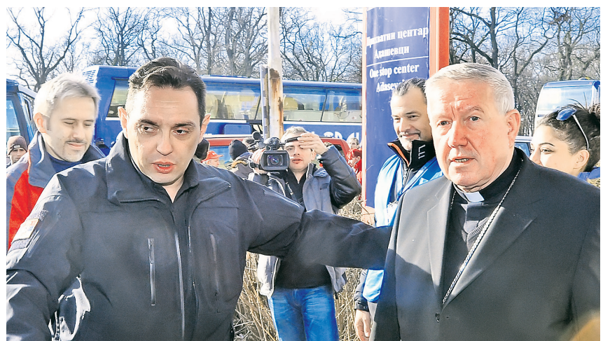
Министар Вулин и надбискуп београдски Станислав Хочевар у Адашевцима

Адашевци – Министар за рад Александар Вулин и представници Организације Каритас Србија, која је до сада издвојила више од 1,5 милиона евра за помоћ мигрантима на територији Србије, обишли су јуче привремено прихватни центар за мигранте у Адашевцима код Шида.